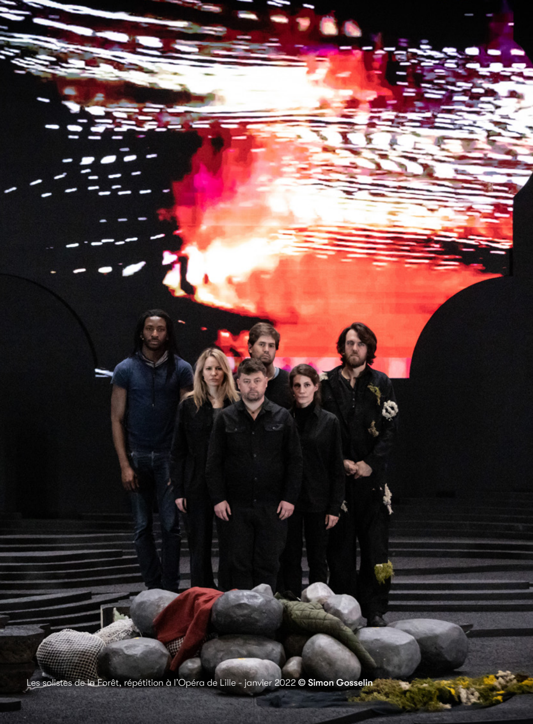
Les solistes de la Forêt, répétition à l'Opéra de Lille - janvier 2022